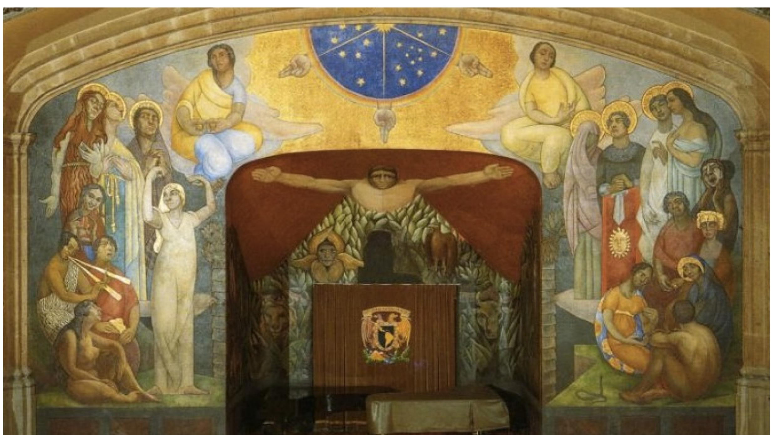
Diego Rivera, La creación , 1922. Anfiteatro Simón Bolívar

Durante la ejecución del mural, Rivera alternó la ejecución de pinturas murales en otros edificios públicos como el de la Secretaría de Educación Pública y la Ex Hacienda de Chapingo; más tarde en Palacio Nacional realizará la Epopéya del pueblo mexicano . En Bellas Artes replicó el mural destruido en el Rockefeller Center de la Ciudad e Nueva York, entre otras grandes obras que culminarían con experimentación de materiales en el Estadio Olímpico de Ciudad Universitaria.